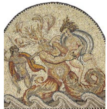
Scenka mitologiczna. Autor: Jarek Konecki