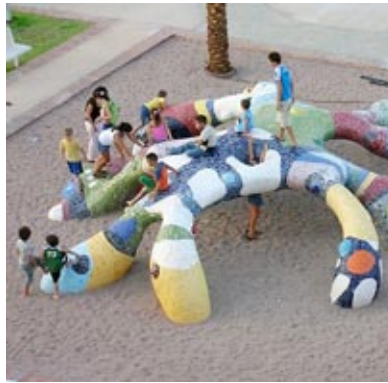
Mozaika w użytkowej przestrzeni publicznej. Autor: Ruslan Sergeev

Wszystkich zapraszam serdecznie na nasz polski portal społecznościowy www.nasze-mozaiki.ning.com . Można tu znaleźć informacje na temat technik, materiałów, ale najważniejsi są koledzy