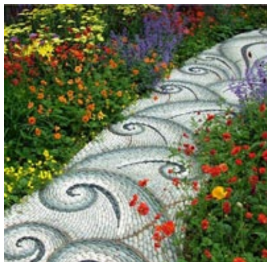
Coraz częściej mozaiki są stosowane w ogrodach. Autor: Maggy Howarth