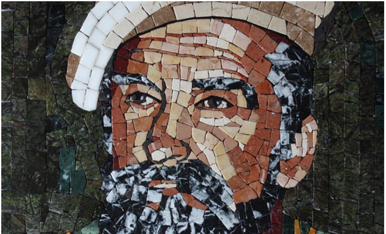
Mozaikowy portret. Autor: Wiesław Ratajczak

Na zakończenie naszego cyklu – mozaikowego samouczka – chciałbym zainspirować Państwa do działania i być może podsunąć kilka pomysłów. Dzisiaj spotykamy się z mozaiką w troszkę innej formie. Tym razem chciałbym pokazać ciekawe sposoby zastosowania mozaiki.