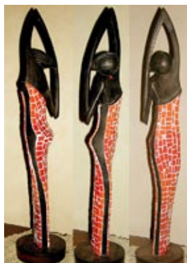
Połączenie rzeźby i mozaiki. Autor: Marlène Touka