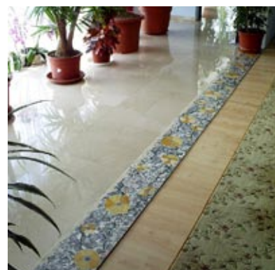
Każdy egzemplarz jest jedyny na świecie. Autor: Lubosz Karwat