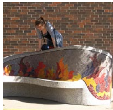
Zastosowanie mozaiki praktycznie nie ma granic. Autor: Lubosz Karwat