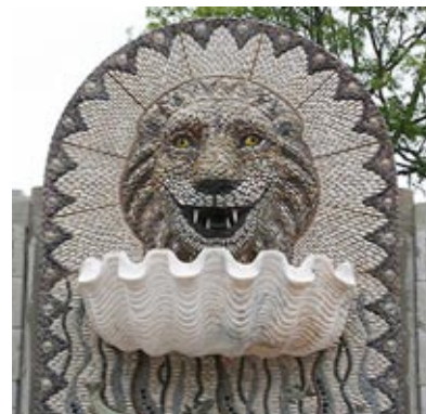
Oryginalna dekoracja źródelka. Autor: Maggy Howarth