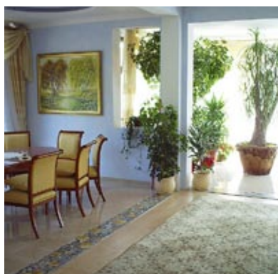
Mozaika jako element porządkujący pomieszczenie. Autor: Lubosz Karwat