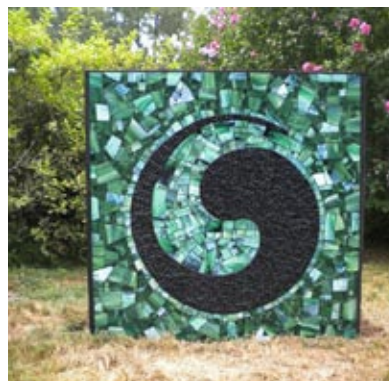
Oryginalna ozdoba ogrodu. Autor: Jackie Stack Lagakos