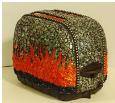
Mozaika wkroczyła też w sferę dekoracji przedmiotów. Autor: Chris Emmert

Mozaika, jak już wiemy, powraca do wnętrza w wielkim stylu, staje się oryginalną formą dekoracji, upiększania czterech kątów. Ku memu zadowoleniu, na naszym polskim rynku mozaikowym odchodzi się od klasycznej mozaiki tesserowej, szuka się czegoś nowego – poprzez inne zestawienia kolorów, wykorzystywanie nowinek technicznych, zestawienia materiałów. Coraz częściej projektanci mozaiki myślą przede wszystkim o efektownej fakturze i światłocieniu, jaki można wydobyć (za pomocą choćby bocznego światła).