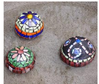
To forma mozaiki dla cierpliwych. Autor: Chris Emmert